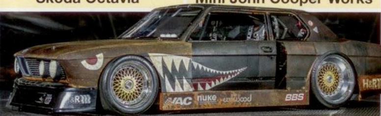
Exklusiv bei uns: SEMA-Star „Rusty Slammington“