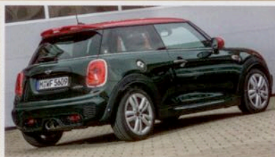
Mini John Cooper Works