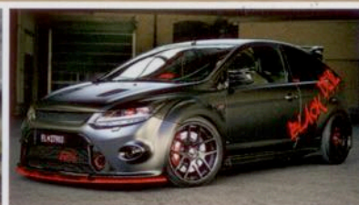
Ford Focus RS