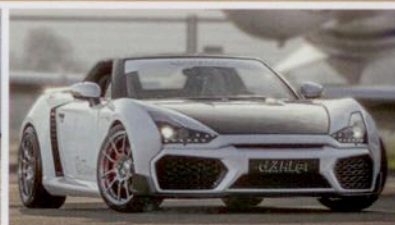
Roding R1 by Dähler