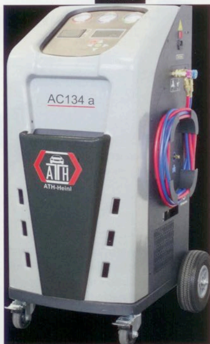
Das neue Klimaservicegerät ATH AC134a von ATH-Heinl für die Wartung von Klimaanlage im Fahrzeug.