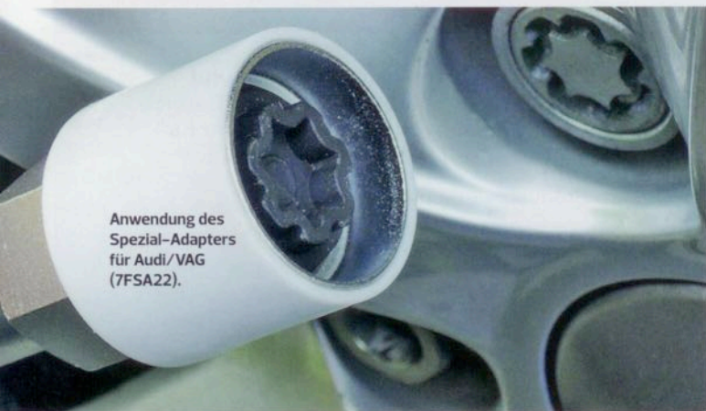
Anwendung des Spezial-Adapters für Audi/VAG (7FSA22).