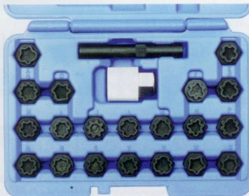
Die Adapter-Sätze sind in der Box so angeordnet, dass ein schnelles Auffinden des passenden Schlüssels möglich ist.

Neu im Angebot des Werkstattausrüsters Kunzer sind die Felgenschloss-Schlüsselsätze für Original-Schlösser der Hersteller Audi/VAG und BMW. Wenn Fahrzeuge zum Räderwechsel in die Werkstatt kommen, fehlt nicht selten der passende Adapter zum jeweiligen Felgenschloss und die Arbeit kann nicht durchgeführt werden. Mit dem 22-teiligen Felgenschloss-Schlüsselsatz von Audi/VAG und dem 20-teiligen Schlüsselsatz von BMW habe man ab sofort immer den passenden Adapter zur Hand.