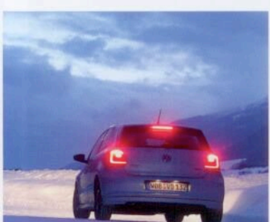
ADAC Reifentest Contis Doppelsieg S. 74