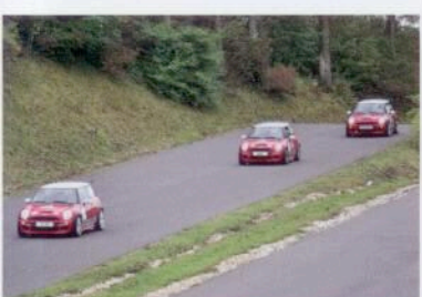
GT Radial Neuer Winterreifen S. 52