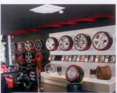
Pirelli Driver Center Einmaliges Store-Konzept S. 54