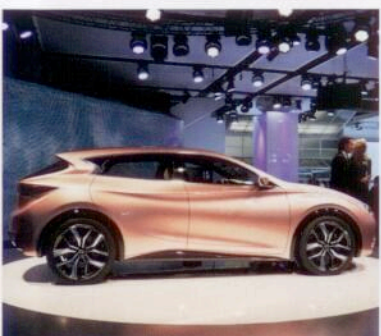
IAA in Frankfurt Zukunfts-Automobile S. 30