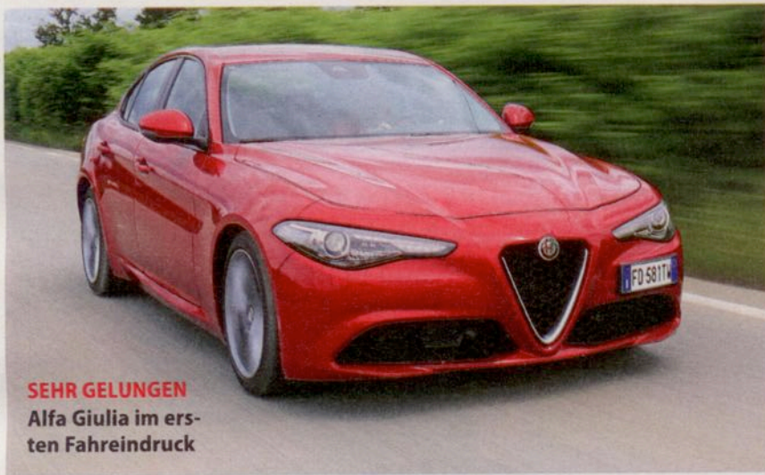
SEHR GELUNGEN Alfa Giulia im ersten Fahreindruck

Test: Mitsubishi Space Star 1.2, Heft 14, Seite 60