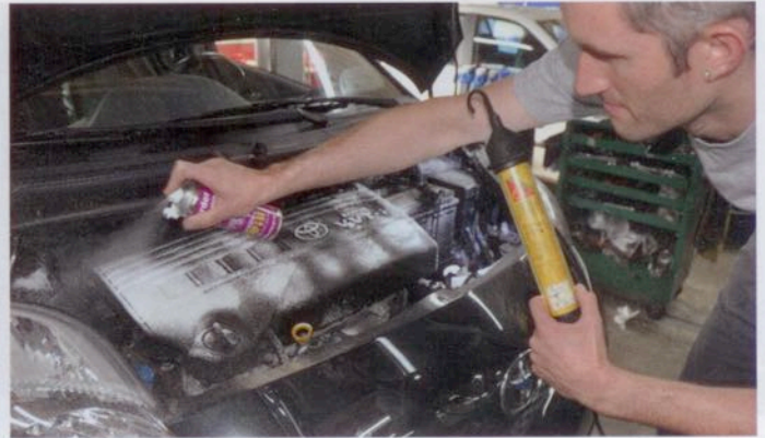
Der Duftmarken-Entferner kommt vor dem Einbau des Gerätes zum Einsatz.

So simpel wie die Klebezettel ist auch der Einbau des Gerätes. Saxer: «Der Einbau selbst ist einfach. Je nach Fahrzeug und Motorraum muss man sich nur überlegen, wo das Gerät am besten platziert wird. Das Hochspannungsgerät 8 Plus-Minus ist für jeden Fahrzeugtyp geeignet – auch für E-Fahrzeuge, Wohnmobile und Oldtimer, weil diese über den Winter meist von der Batterie abgehängt werden.»