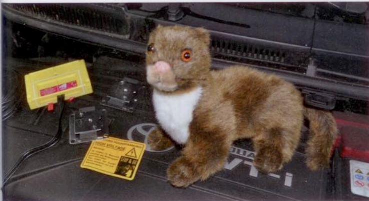
Das Gerät ist kaum grösser als eine Kassettenhülle, aber sehr effektiv.