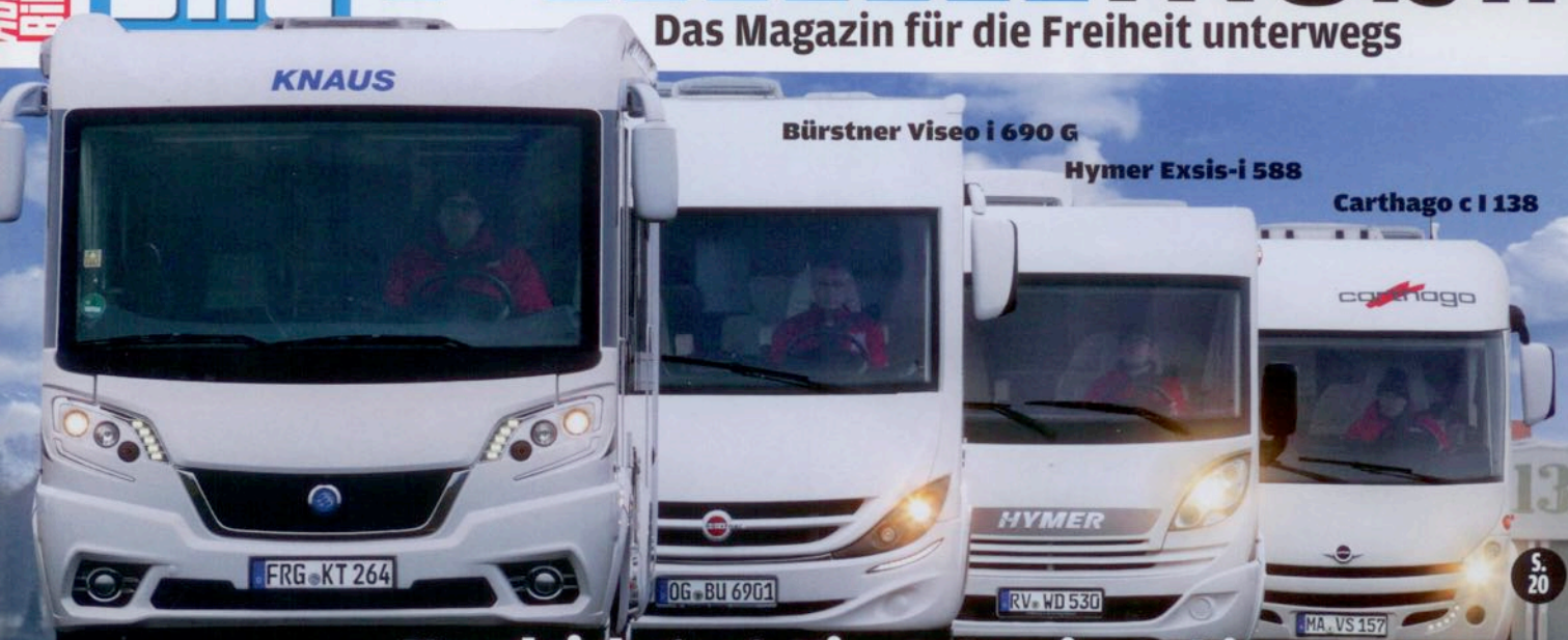
Knaus Van i 650 MEG