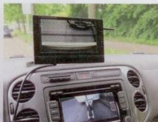
Leicht zu installieren: die Rückfahrkamera FRV7-1 von Conrad.

simple Montage. In der Tat reicht es, den Empfängermonitor am Zigarettenanzünder einzustecken und die Funkkamera am Caravanheck mit 12 Volt zu versorgen. Bei unseren Tests zeigte sich, dass die Übertragung tatsächlich funktioniert, leider aber häufig gestört ist. Der Bildwinkel der Kamera von 90 Grad reicht zudem kaum aus, die volle Breite des Caravanhecks abzubilden. Hindernisse hinterm Caravan sind aber allemal zu erkennen, Rempler lassen sich vermeiden. www.conrad.de