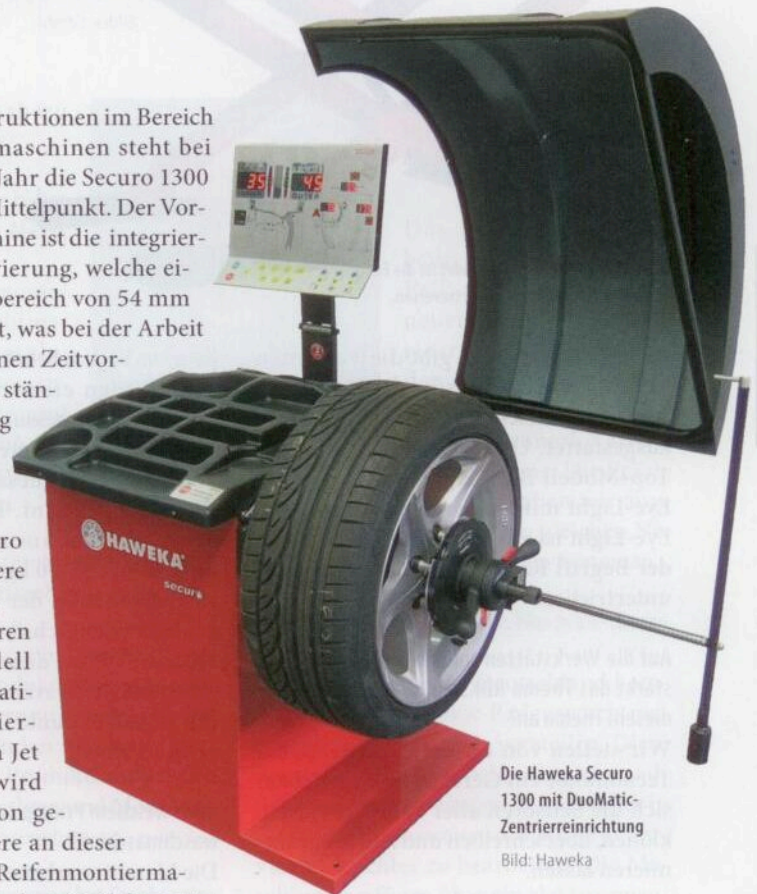
Die Haweka Securo 1300 mit DuoMatic-Zentrierreinrichtung

Neu im Programm bei Haweka ist eine Radwaschmaschine. Diese Maschine eignet sich sowohl für den Einsatz in einer Werkstatt, ist aber optional auch mit einem Münzfach auszustatten. Auf diese Weise kann ein Betrieb diese Maschine auch im SB-Betrieb laufen lassen. So ha-