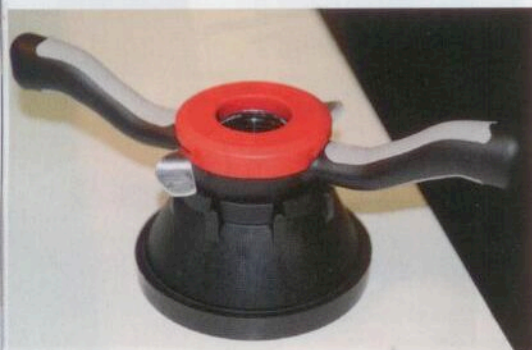
Auch eine bewährte Schnellspannmutter lässt sich verbessern, wie Haweka mit der neuen Softgrip demonstriert.

Auch für den Bereich des Nutzfahrzeug-Reifenservice hat Haweka passende Produkte im Programm. Auf der Reifenmesse wird zum Beispiel die Lkw-Reifenmontiermaschine TBE 4315 präsentiert. Im Bereich Nutzfahrzeuge ist Haweka auch mit den Axis-4000-Achsvermessungssystemen engagiert, welche bei unterschiedlichen Fahrzeugtypen und Dimensionen eingesetzt werden können. Bernd Reich