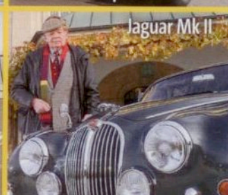
Jaguar Mk II