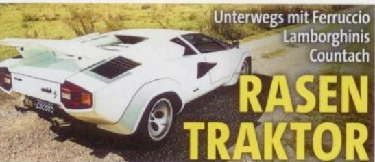
Unterwegs mit Ferruccio Lamborghini's Countach