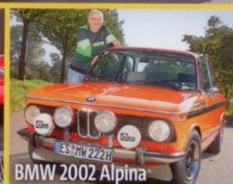
BMW 2002 Alpina